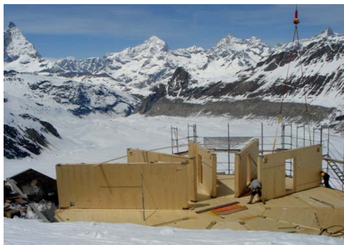
Die Holzbau-Arbeiten: Ein anspruchsvolles Puzzle aus 420 Einzelteilen.