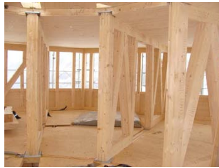
Die Baustelle Mitte Mai 2009; rechts ein Blick in die gemütlichen Stuben des Essraumes.

Die in Mörel vorgefertigten Holzelemente gelangen mit der Gornergrat-Bahn zum Zwischenlager auf der Riffelalp. Von dort werden sie mit dem Hubschrauber zur Baustelle geflogen und einem Puzzlestück gleich passgenau eingesetzt; der Hubschrauber dient dabei als Kran.